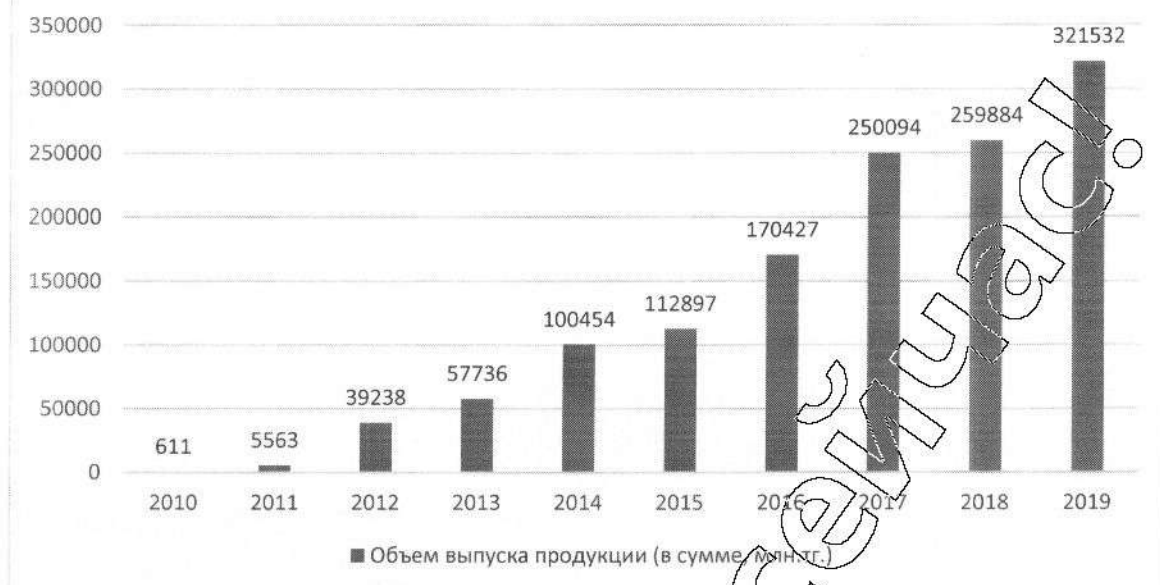
Выпуск продукции МСП за 2010-2020 г.г.

Данный факт связан с ежегодным увеличением числа МСП участвующих в Программе, и получивших государственную поддержку по инструментам субсидирования и гарантирования. Ежегодное увеличение финансирования, а также вследствие чего увеличивающееся количество участников Программы прямо влияет на рост выпускаемой продукции МСП.